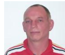
Egon Omsen Landestrainer