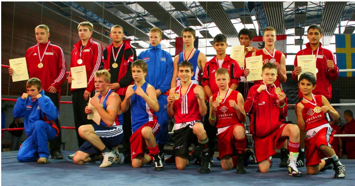
Gewinner des 5. Internationalen Berliner TSC Boxturniers

Dieser September ist ein wichtiger Monat im Kalender des Jugendboxsportes. Es wird nun schon zum 6. Male das internationale Boxturnier in den Hallen des Berliner TSC ausgetragen. Vor über 200 Zuschauern beweisen ein Wochenende lang geladene Mannschaften aus Usbekistan, Holland, Russland, Polen und Deutschland, auf welchem hohen Niveau sich Jugendboxsport bereits abspielt. Dabei stehen sich ca. 20 Nationalitäten und viele regionale Meister im Ring gegenüber und werden sich spannende und fordernde Kämpfe liefern. Daneben wird dieses Turnier von einem kulturellen Rahmenprogramm, bestehend aus u.a. einer Tombola, einer Lichtschau, Musikern und Tanzgruppen, begleitet. Es ist gelebter Begeisterung am Sport und die kulturelle Vielfalt der Menschen, die dieses Turnier für die Sportler, Zuschauer und Förderer zu einem Besonderen werden lassen. Wir beginnen schon jetzt mit den Vorbereitungen für dieses Jahr und freuen uns auf Ihre Unterstützung.